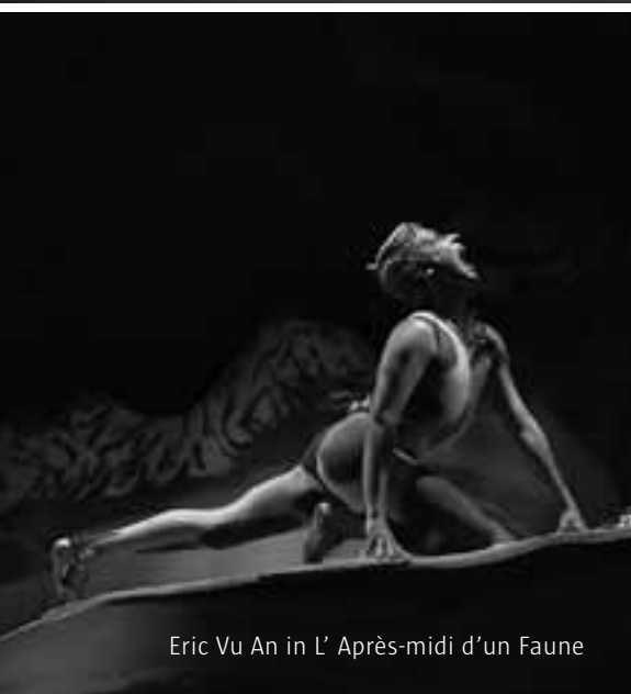
Eric Vu An in L'Après-midi d'un Faune